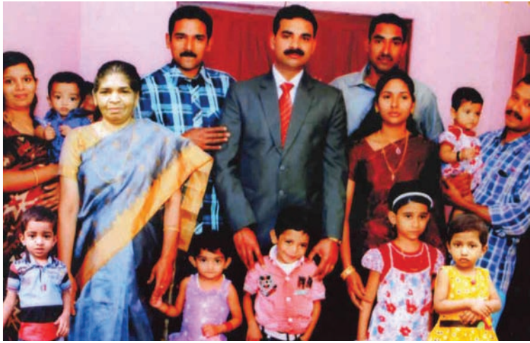
കിഴക്കേതൊട്ടിയിൽ (മുശാരിയേട്ടി) പാപ്പച്ചന്റെ ദാമ്യ ക്ലാരമ്മയും കുടുംബവും (കൽത്തൊട്ടി)