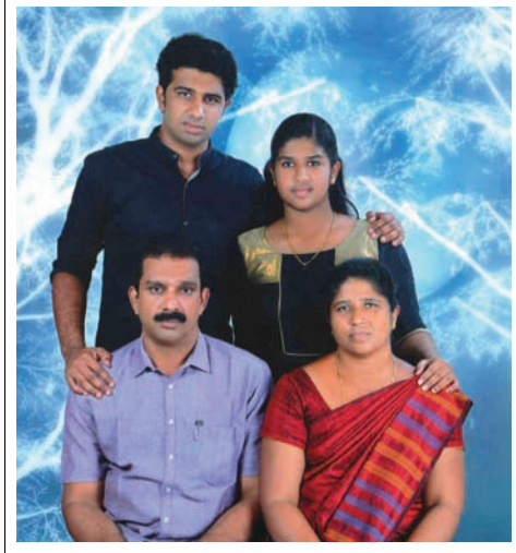
തുണ്ടത്തിലേട്ട് ചെറിയാച്ചനും കുടുംബവും